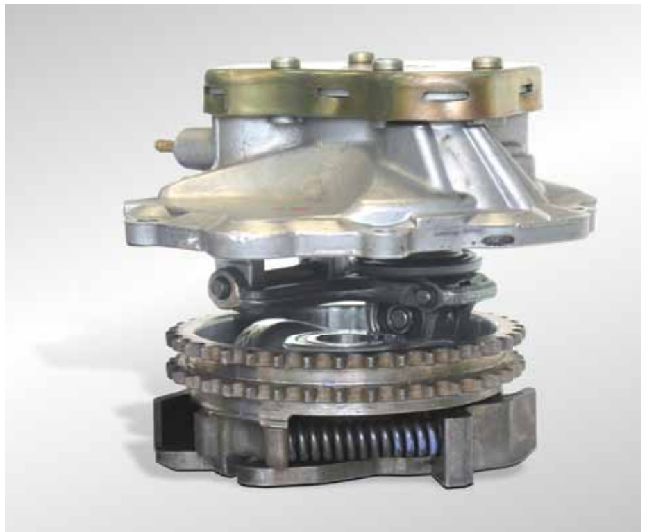
Bombas de vacío de la serie 7.20607... (arriba) en el variador de avance

Para la colocación y la sustitución, véanse los catálogos, el CD TecDoc y/o los sistemas basados en datos TecDoc.