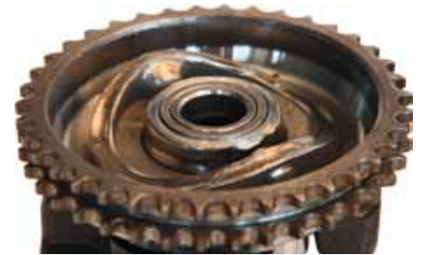
Disco de leva desgastado