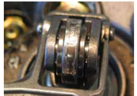
Aspecto del daño: rodillo de deslizamiento con muescas (“pittings”) causadas por un disco de leva desgastado