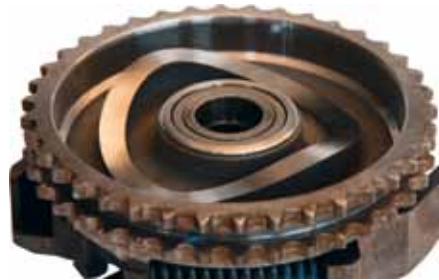
Disco de leva en perfecto estado

El disco de leva se debería enviar también para dictaminar casos de reclamaciones.